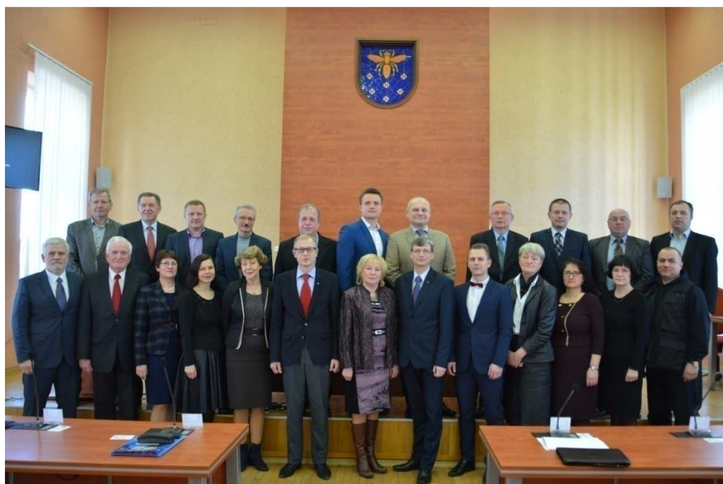
VIII šaukimo Savivaldybės taryba (2015–2019 m.)

Varėnos rajono savivaldybės taryboje suformuota dauguma, mažuma (opozicija), veikia Savivaldybės tarybos narių frakcijos, taip pat yra Tarybos narių, nepriklausančių frakcijoms.