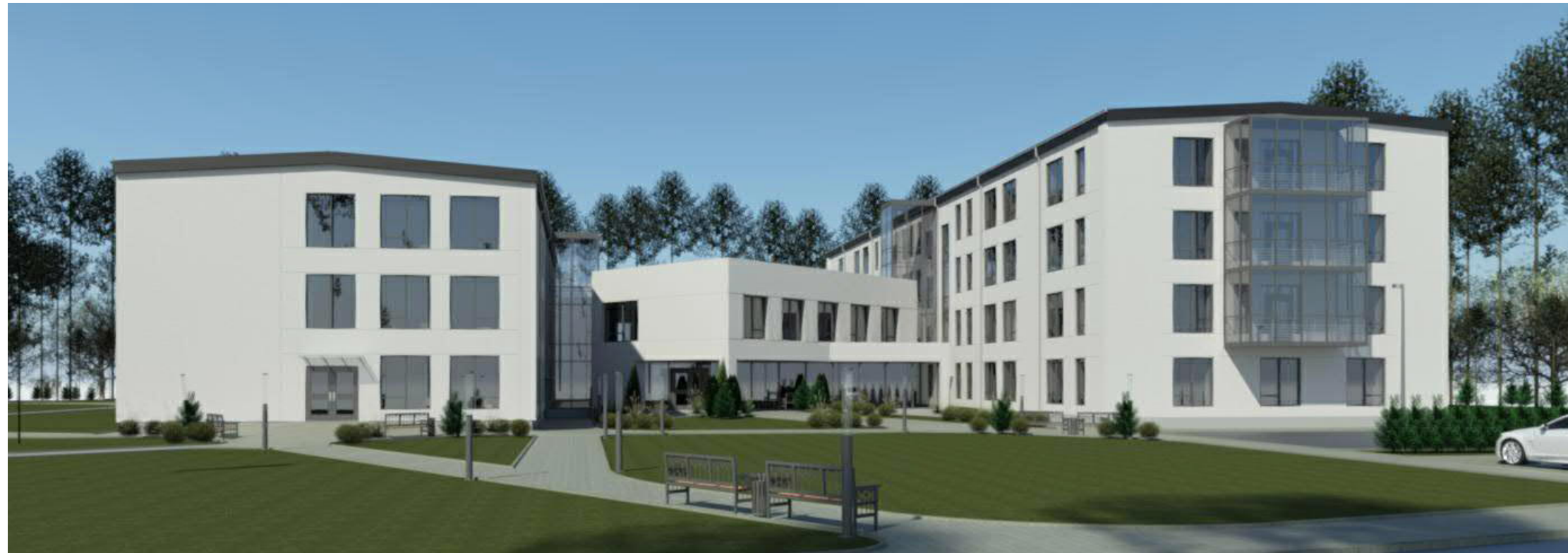
Šiaurės rytų vaizdas