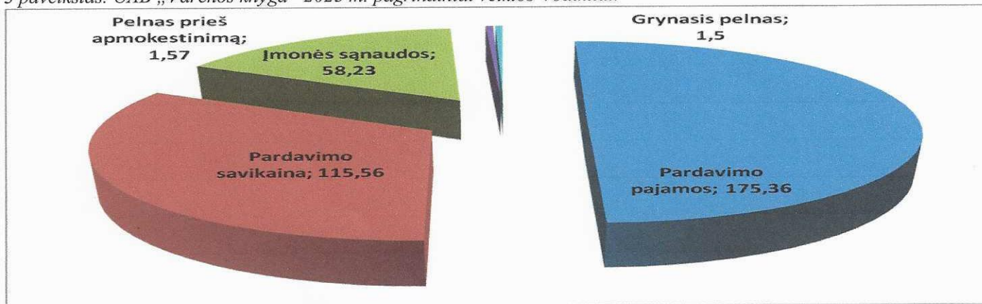
3 paveikslas. UAB „Varėnos knyga“ 2023 m. pagrindiniai veiklos rodikliai.

2023 m. ir 2022 m. įmonės UAB „Varėnos knyga“ veikla buvo pelninga.