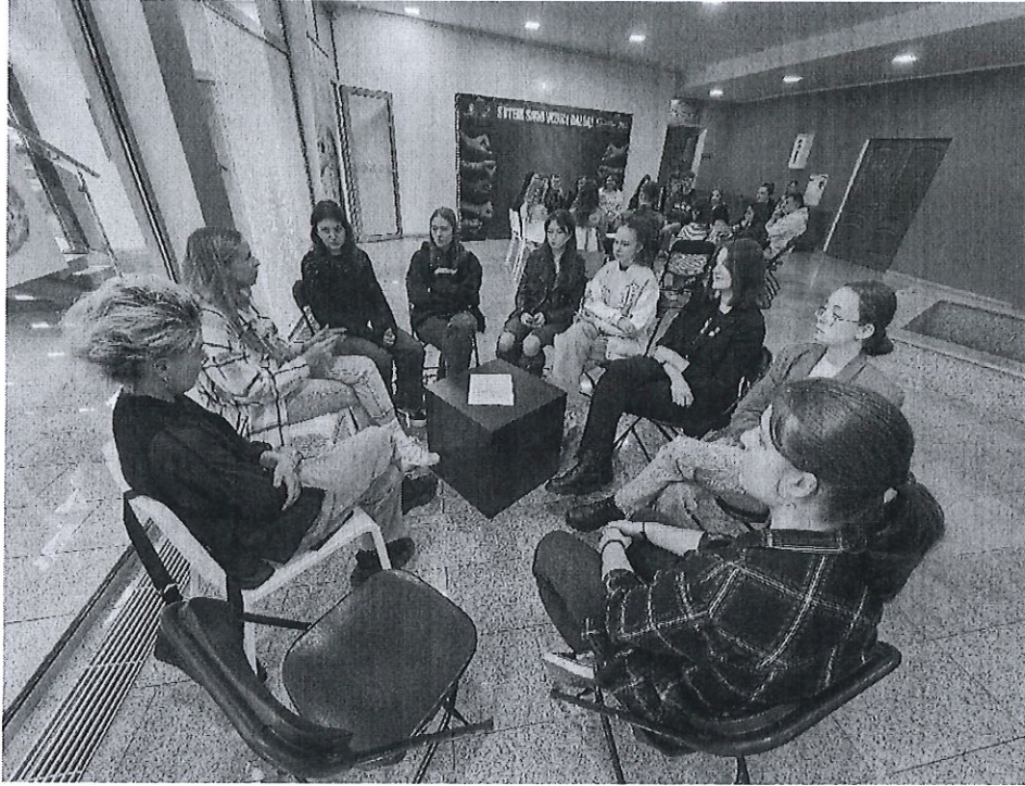
2 pav. Europos jaunimo savaitės renginys

Gegužės 8 d. Varėnos kultūros centre duris atvėrė nauja jaunimo erdvė (3 pav.). Bendraminčių apsuptyje jaunimas gali turiningai leisti laisvalaikį, realizuoti savo idėjas, diskutuoti jiems svarbiais klausimais bei užmegzti naujų pažinčių ratą. Taip pat šia proga buvo paminėta ir Lietuvos įstojimo į Europos Sąjungą diena. Diskusijos su jaunimu metu rajono vadovas ir Varėnos kultūros centro direktorė aptarė labiausiai jiems rūpimas aktualijas, išgirdo jaunuolių nuomones bei lūkesčius.