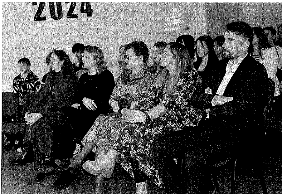
6 pav. Savanorių apdovanojimai 2024

savimi. Vakaro metu vaizdo skambučiu pasikalbėta su dviem savanorėmis, kurios mielai pasidalijo savo patirtimi.