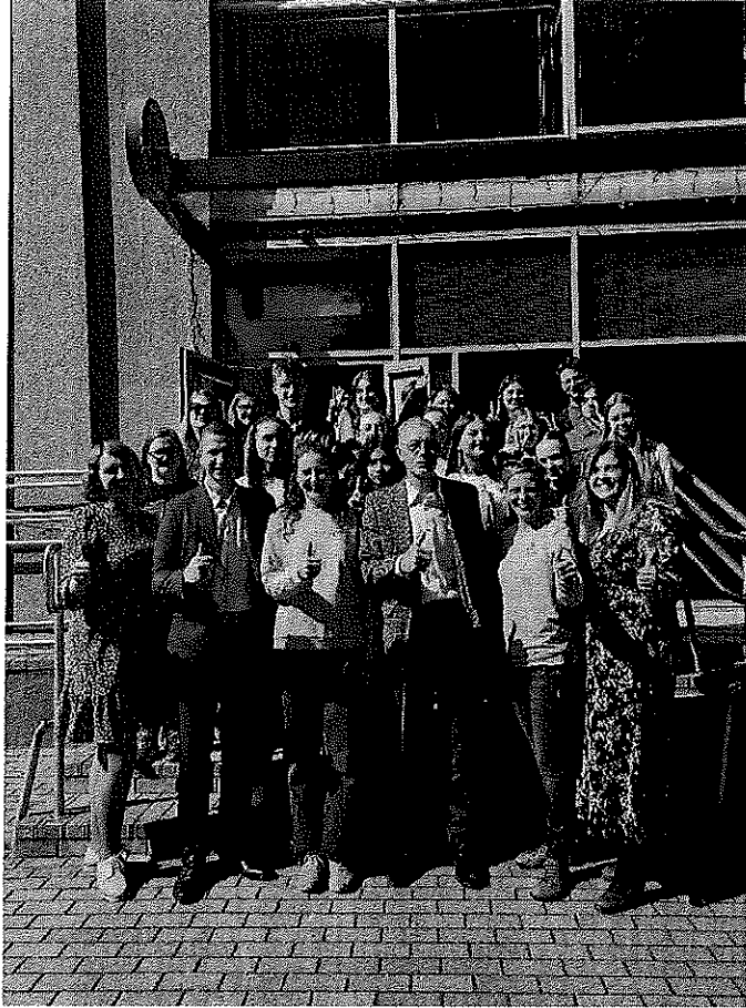
3 pav. Jaunimo erdvės Varėnos kultūros centre atidarymas