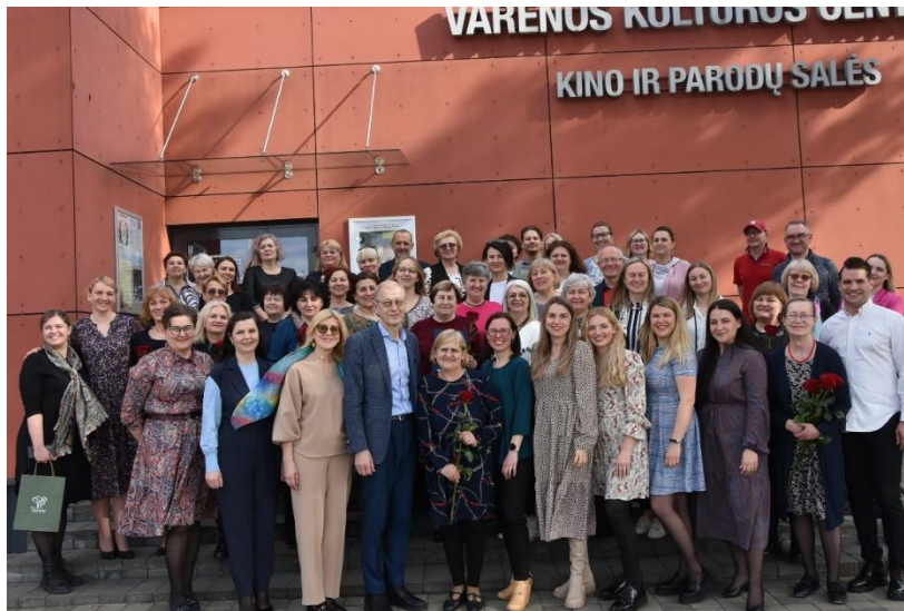
Pasaulinės meno dienos Varėnoje akimirka