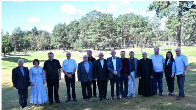
Susitikimo su rajone tarnaujančiais kunigais akimirka

Susitikimas su rajone tarnaujančiais kunigais. Siekdami stiprinti bendradarbiavimą tarp savivaldybės ir bažnyčios bendruomenių, norint užtikrinti efektyvesnę pagalbą bažnyčiai ir skatinti tarpusavio supratimą bei paramą rugpjūčio 21 d. organizuotas Varėnos rajono savivaldybės vadovų ir rajone tarnaujančių kunigų susitikimas. Susitikimo metu buvo aptarti aktualūs klausimai, pasidžiaugta atliktais darbais ir bendryste.