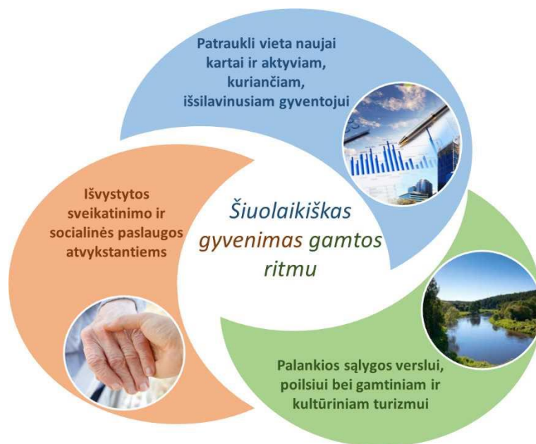
I pav. Varėnos rajono savivaldybės plėtros vizija iki 2028 metų

III. APLINKA – kurti bei išlaikyti kokybišką gyvenamąją aplinką, patrauklią tiek naujajai kartai, tiek esamiems gyventojams.